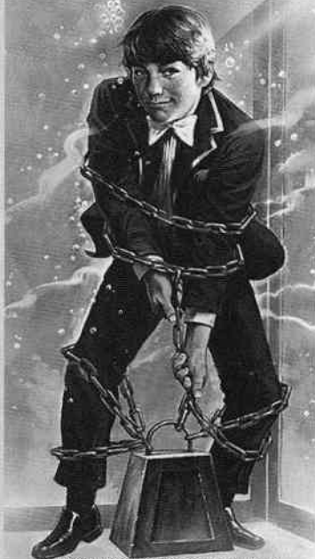
"THE ESCAPE ARTIST" GRIFFIN O'NEAL RAUL JULIA TERI GARR JOAN HACKETT GABRIEL DELL DESIDERIO ARNAZ Music by and illustrations by GEORGES DELERUE

The remarkable story of an unusual boy who takes on the world... and wins.